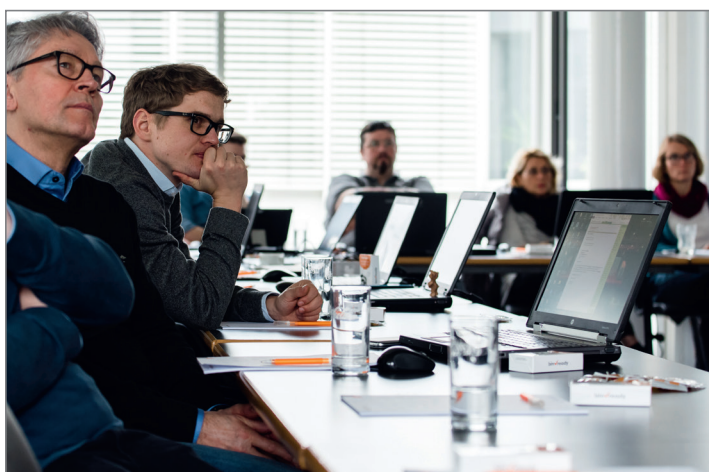
BIM-Konstrukteur, BIM-Koordinator, BIM-Manager: BIM Ready ist eine Ausbildung von MuM, die auf die verschiedenen Aufgaben und Rollen im BIM-Prozess zugeschnitten ist.